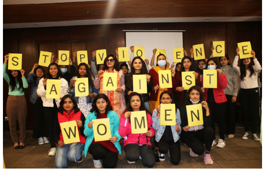
अन्तर्राष्ट्रिय महिला दिवसको अवसरमा महिला हिसां विरुद्ध फोटो स्टन्टमा सहभागी हुँदै। २०७८ फागुन (मार्च २०२२)

आबद्ध स्थानीय नेटवर्क वा समूहको अर्को महत्त्वपूर्ण काम अर्थसङ्कलन हो। एम्नेस्टी इन्टरनेसनल नेपालमा आबद्ध हुने कुनै पनि स्थानीय समूह वा नेटवर्कलाई एम्नेस्टी इन्टरनेसनल नेपालबाट नियमित अनुदान प्राप्त हुँदैन र एम्नेस्टी इन्टरनेसनल त्यसरी नियमित अनुदान दिने जोनर एजेन्सी पनि होइन। तसर्थ स्थानीय नेटवर्क वा समूह सञ्चालनका लागि आवश्यक पर्ने आर्थिक स्रोत जुटाउन अर्थसङ्कलनका कार्यक्रमहरू गर्नु एम्नेस्टी इन्टरनेसनल समूह र युथ नेटवर्कको अर्को महत्त्वपूर्ण काम हो।