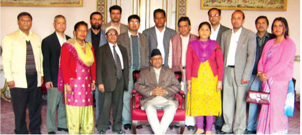
पूर्व राष्ट्रपति डा. रामवरण यादवसँग भेटघाट गर्दै एम्नेस्टी नेपालको प्रतिनिधिमण्डल । २०६५ फागुन (मार्च २००९)