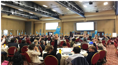
सन् २०१७ मा इटलीको रोममा आयोजित एम्नेस्टी इन्टरनेसनलको ३३ औं र अन्तिम आइसिएम (International Council Meeting) मा भेटिङ्ग कार्ड उठाएर विभिन्न शाखाका प्रतिनिधिहरू मतदान गर्दै ।

क्षेत्रीयस्तरमा एम्नेस्टी इन्टरनेसनलका शाखाहरूको क्षेत्रीय मञ्च (Regional Forum) भेला हुने गर्दछ जहाँ एम्नेस्टीका विभिन्न महादेशीय क्षेत्रका (अमेरिका, एसिया प्यासिफिक, अफ्रिका, युरोप, मध्य पूर्व र उत्तरी अफ्रिका) एम्नेस्टी शाखाहरूले मानवअधिकारका क्षेत्रीय विषयहरू लगायत आसन्न ग्लोबल असेम्ब्लीमा निर्णयार्थ प्रस्तुत गरिने विभिन्न विषयवस्तुहरूमा तयारी छलफलहरू गर्ने गर्दछन् ।