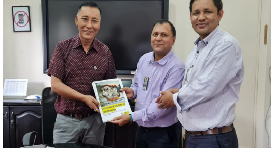
एम्नेस्टी नेपाल र आत्मनिर्भर केन्द्रद्वारा प्रकाशित "संरक्षणको नाममा मानवअधिकार उल्लङ्घन" विषयक प्रतिवेदनको निष्कर्ष तथा सुझावहरू डब्ल्युडब्ल्यूएफ (WWF) का प्रतिनिधिहरूले हस्तान्तरण गर्दै । २०७९ वैशाख (मे २०२२)

अर्थसङ्कलन अभियान सञ्चालनको अभिन्न पाटो भएकाले एम्नेस्टी इन्टरनेसनलमा