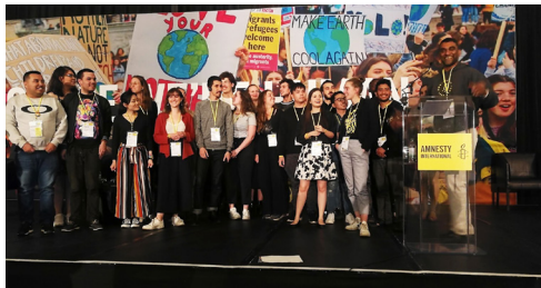
सन् २०१९ मा दक्षिण अफ्रिकाको जोहानेसबर्गमा आयोजित एम्नेस्टी इन्टरनेसनलको दोश्रो ग्लोबल असेम्ब्लीमा तत्कालीन महासचिव कुमी नाइडु एम्नेस्टी का युवा सदस्यहरूमाथि जलवायु परिवर्तनले मानवअधिकारमा पारेको असरसम्बन्धी छलफल सत्रपछि ।