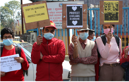
रसियाद्वारा युक्रेनमाथि गरिएको आक्रमणको विरोधमा रसियन दूतावास अगाडि गरिएको प्रदर्शन । २०७८ फागुन (मार्च २०२२)