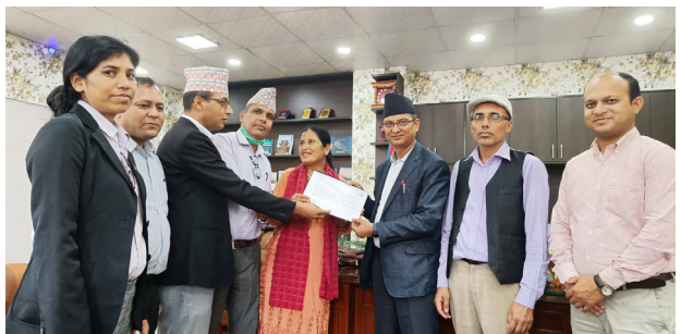
सङ्क्रमणकालीन न्याय कानून संशोधनका लागि प्रारम्भिक सुझावहरू कानून न्याय तथा संसदीय मामिला मन्त्री माननीय गोविन्द शर्मा कोइरालाज्यूलाई हस्तान्तरण गर्दै नागरिक समाज तथा पीडित समुदायका प्रतिनिधिहरू । २०७९ असार (जुलाई २०२२)

एम्नेस्टी इन्टरनेसनल नेपाल वर्तमान अवस्थासम्म आइपुग्दा विभिन्न ४३ जिल्लामा यसका ८६ वटा स्थानीय समूह, ४ वटा निर्माणाधीन समूह र ५७ वटा युथ नेटवर्कहरू रहेका छन् । यस संस्थामा हाल (जुन २०२२ मा) देशभर करीब ७,००० सदस्यहरू रहेका छन् जसमा करिब ३०० जति समर्थक सदस्यहरू समेत रहेका छन् । ती सदस्य र यस संस्थामा आबद्ध स्थानीय समूह र नेटवर्कहरूले एम्नेस्टी इन्टरनेसनल नेपालको प्राथमिकतामा परेका अभियानहरूलाई स्थानीयकरण (Localization) गर्दै विभिन्न कार्यक्रमहरू गरिरहेका छन् ।