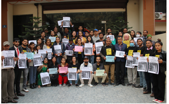
राइट फर राइट्स अभियान २०२१ को तयारी कार्यशालामा सहभागी एम्नेस्टी नेपालका अभियन्ताहरू । २०७८ कार्तिक (नोभेम्बर २०२१)