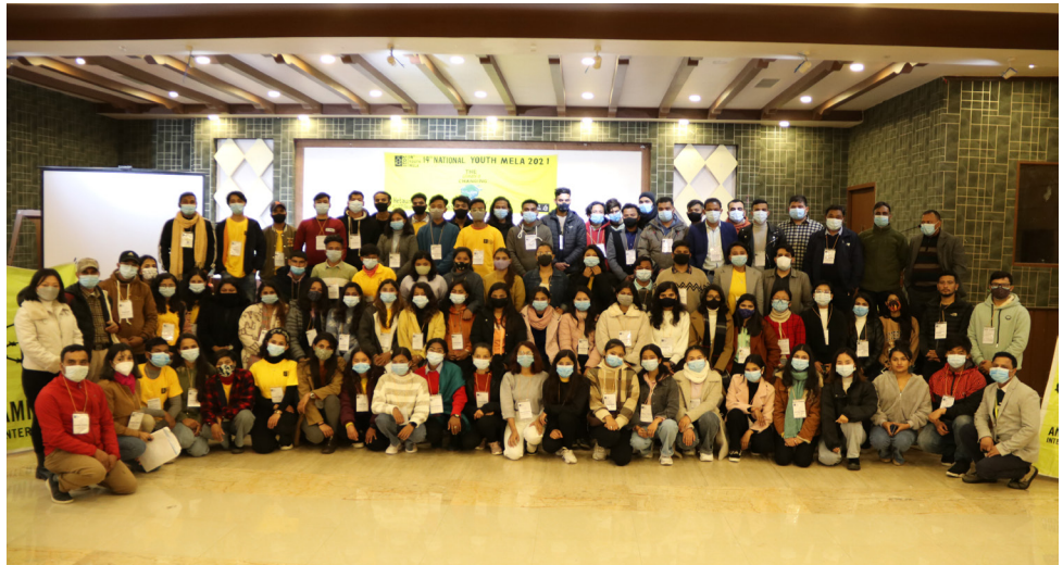
हेटौंडामा आयोजित १४ औं युथ मेलामा सहभागी एम्नेस्टी नेपालका युवा सदस्य प्रतिनिधिहरू। २०७८ माघ (डिसेम्बर २०२१)