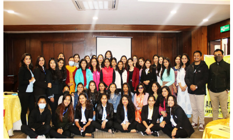
अन्तर्राष्ट्रिय महिला दिवसको अवसरमा बुमन इन बिग डेटा नेपाल सँगको सहकार्यमा एम्नेस्टी नेपालका सदस्यहरूलाई डेटा सुरक्षासम्बन्धी कार्यशाला । २०७८ फागुन (मार्च २०२२)

एम्नेस्टी इन्टरनेसनल नेपाललाई नेपालमा कार्यरत संस्थाहरूमध्ये एक अग्रणी मानवअधिकार संस्थाका रूपमा चिन्ने गरिन्छ ।