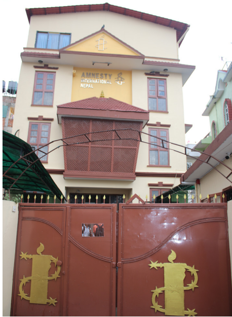
एम्नेस्टी इन्टरनेसनल नेपाल, राष्ट्रिय सचिवालय, काठमाडौं।

एम्नेस्टी इन्टरनेसनल नेपालको नीति तथा कार्यक्रमहरू कार्यान्वयन गर्नको लागि राष्ट्रिय सचिवालय रहेको छ। सचिवालयको प्रमुखमा एक जना निर्देशक रहन्छन्। राष्ट्रिय सचिवालयले एम्नेस्टी इन्टरनेसनलको अन्तर्राष्ट्रिय नीति तथा एम्नेस्टी इन्टरनेसनल नेपालको वार्षिक साधारणसभाको निर्णयबमोजिम गतिविधि सञ्चालन गर्ने गर्दछ। यसले एम्नेस्टी इन्टरनेसनलको अन्तर्राष्ट्रिय सचिवालय तथा क्षेत्रीय कार्यालयहरू तथा विभिन्न देशका शाखाहरूसँग समन्वयको काम पनि गर्दछ।