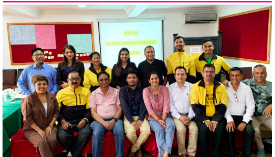
एम्नेस्टी इन्टरनेसनल नेपालको नवनिर्वाचित नेसनल बोर्ड र पुनरावेदन समितिका पदाधिकारी र सदस्यहरूको लागि आयोजित इन्डक्सन कार्यक्रम पछि । २०७९ जेठ (मे २०२२)