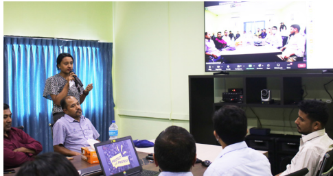
एम्नेस्टी इन्टरनेसनलको विश्वव्यापी अभियान "विरोधको संरक्षण गरौं" (Protect the Protest) नेपालमा प्रारम्भ गर्दै। २०७९ साउन (जुलाई २०२२)

कुनै देशका एम्नेस्टी इन्टरनेसनलमा आबद्ध सदस्य, समूह र नेटवर्कहरूले स्थानीयस्तरमा वा सम्बन्धित देशमा भएका मानवअधिकार हननका घटनामा एम्नेस्टी इन्टरनेसनलका तर्फबाट अध्ययन अनुसन्धान गर्ने, विज्ञापित जारी गर्ने लगायतका अनुसन्धानात्मक कामहरू गर्न सक्दैनन्। एम्नेस्टी इन्टरनेसनलका स्थानीय सदस्यहरू वा यसमा