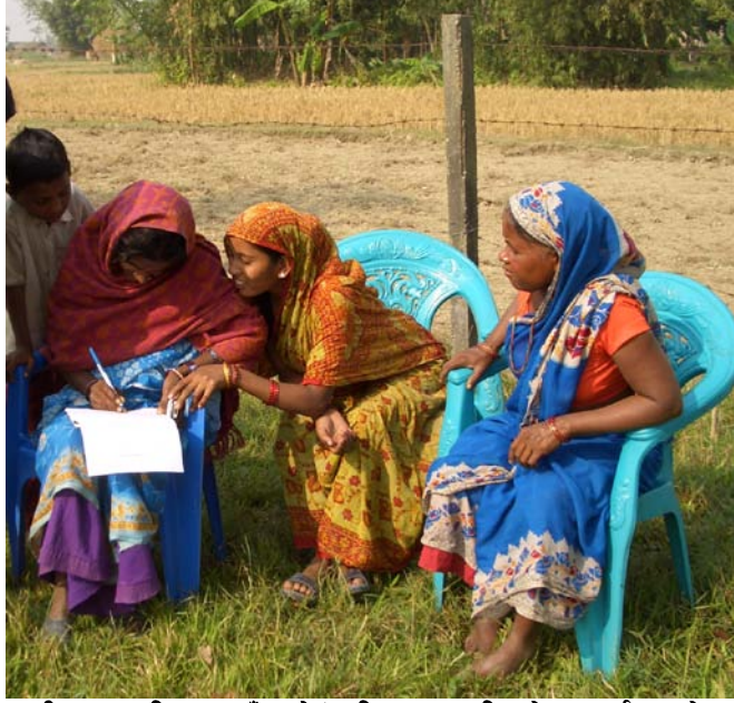
तस्वीर १५: परिवारहरूसँग मोरंग जिल्लामा गरिएको अन्तर्वाता

उपलब्ध भयो तर नपाएको तलबको मुद्दालाई त्यसै छाड्न पत्रो (कुवेत र साउदी अरेबिया); एक जनाले आफ्नो पासपोर्ट र घर फर्कने टिकट लिन प्रहरी अधिकृतलाई घुस खुवाउनु पत्रो; र अर्कोलाई प्रहरीले फिर्ता पठाइदियो (कुवेत) ।