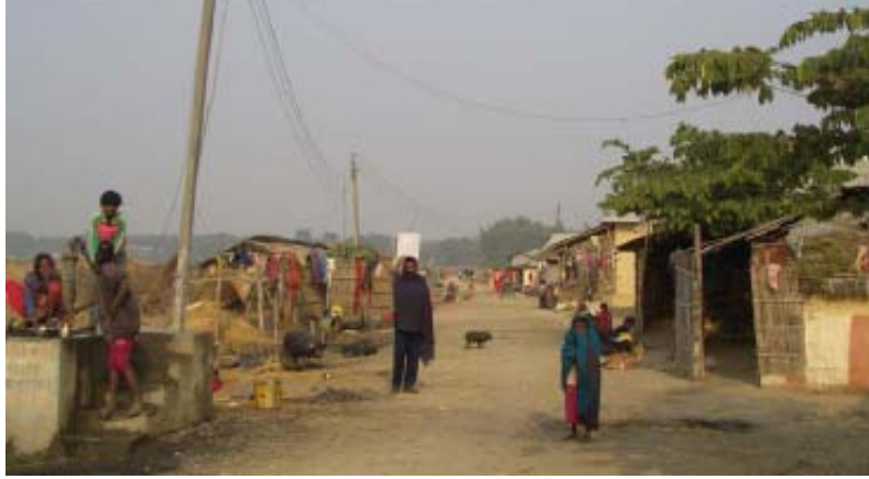
तस्वीर १ : सुनसरी जिल्लाको एउटा दलित बस्ती जहाँ अन्तर्वार्ता गरिएको थियो

अन्तर्वार्ताहरूलाई स्थानीय गैर सरकारी संस्था र एउटा ट्रेड युनियनले सहजीकरण गरेको थियो। ३२ ती विदेशबाट फर्केका नेपालीहरू सुदूर-पश्चिमाञ्चल, पश्चिमाञ्चल, मध्यमाञ्चल र पूर्वाञ्चल विकास क्षेत्रका मूल बासिन्दाहरू थिए (हेर्नुहोस् अनुसूची २ मा नक्सा) र यसमा धेरै आप्रवासी श्रमिकहरू आउने ३३ नेपालको सबैभन्दा गरीब क्षेत्रहरू मध्येको एक तराईबाट पनि थिए। ३४ एकल रूपमा अन्तर्वार्ता दिनेहरूमध्ये ५६ पुरुष र २५ महिला थिए।