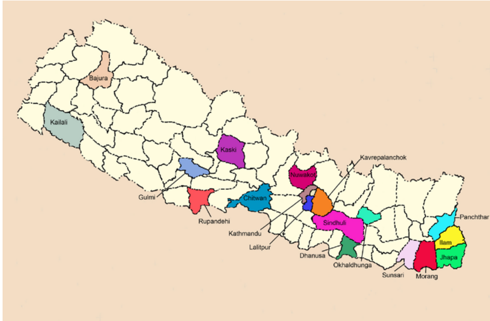
अन्तर्वाता लिइएका आप्रवासी श्रमिकहरूका गृहजिल्लाहरू