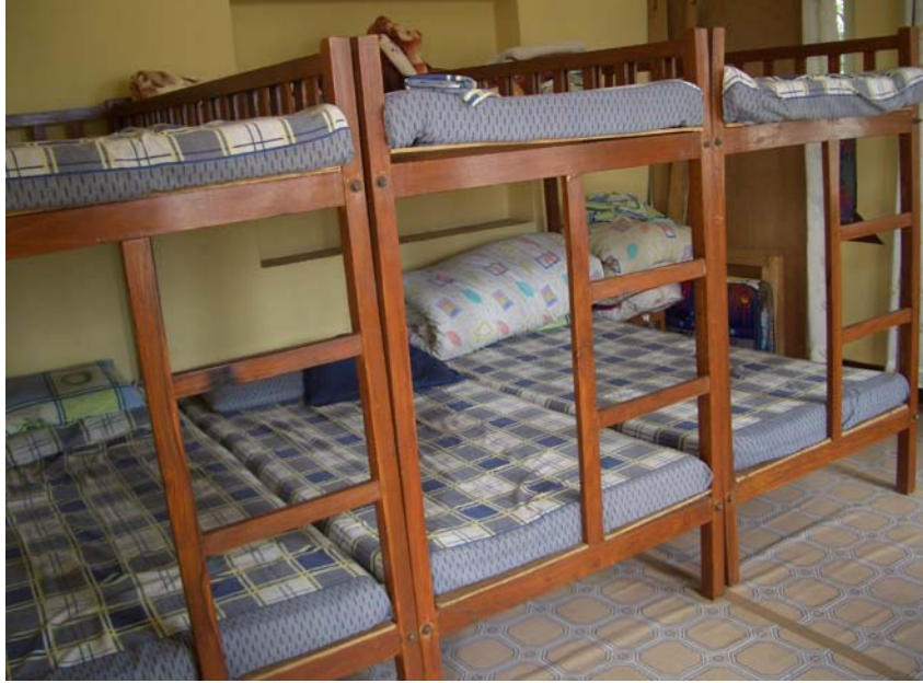
तस्वीर १३ : नेपाली गैसस पौरखीद्वारा सञ्चालित आश्रय केन्द्र, काठमाडौँ

एसडी हाल काठमाडौँको एउटा आश्रय केन्द्रमा आफ्नो छोराका साथ बस्दै आएकी छिन् । उनी विदेशमा रहँदा बच्चलाई जन्म दिएको कुरा उनका अभिभावकलाई थाहा छैन । २०४