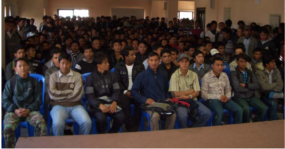
फोटो ८ : स्काई ओभरसिज नामक वैदेशिक रोजगार एजेन्सी, काठमाडौंमा प्रस्थानपूर्वको अभिमुखीकरण तालिम हुँदै

यो तालिमले आप्रवासको प्रक्रियाको सहजीकरण गर्ने र गन्तव्य मुलुकमा आफ्नो अधिकार र दायित्वका बारेमा नेपाली आप्रवासी श्रमिकहरूले बुझेको सुनिश्चित गर्नुपर्छ। सीपमूलक तालिम आवश्यकता पर्ने कामका लागि श्रमिक नियुक्त भएको अवस्थामा ऐनको दफा ३० मा त्यस्तो तालिम पनि स्वीकृत संस्थाबाट लिइनुपर्ने उल्लेख गरिएको छ। १२१