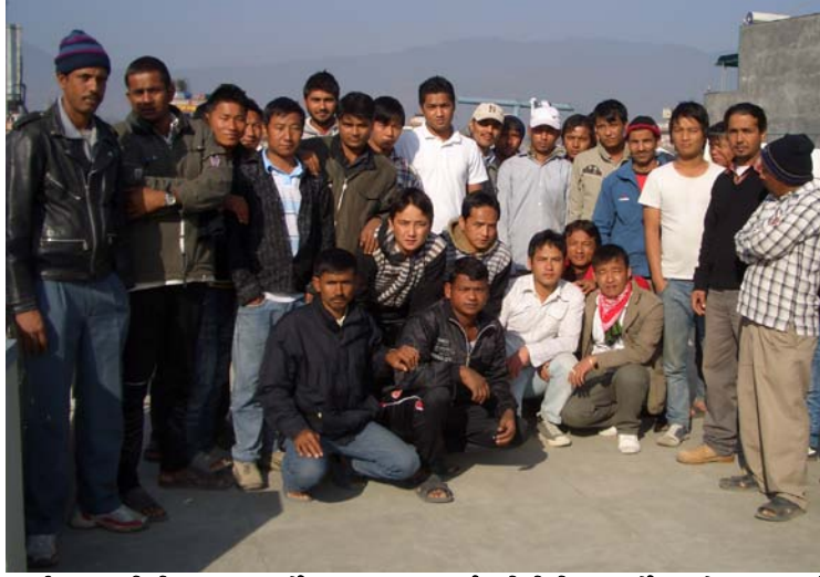
तस्वीर ७ : लिबियाबाट फर्केका ४६ जनालाई प्रतिनिधित्व गर्नेहरूको समूह

“हामीले भापा, मोरङ र सुनसरी जिल्लाहरूमा रहेका शाखा कार्यालयका एजेन्टहरूलाई रु. एक लाख २५ हजार देखि एक लाख ३० हजार (१,७३०-१,८१० अमेरिकी डलर) सम्म दियोँ। हामीले यो रकम स्थानीय साहुहरूसँग ३६ देखि ६० प्रतिशत ब्याजमा सापट लिएका हौँ। यो साँवा रकम नै हामीमध्ये कसैले चुक्ता गरेको छैन। हाम्रो एजेन्टले बताएअनुसार यो रकममा भिसा, हवाई टिकट र बीमा समावेश छ। हामीले स्वास्थ्य परीक्षण, एयरपोर्ट कर र अभिमुखीकरणका लागि अलग्गै तिर्नुपऱ्यो। खर्चहरूको विवरण नखुलाईकन कुल रकमको मात्र रसिद त्यो पनि हामीमध्ये केवल पाँच प्रतिशतले मात्र प्राप्त गरेका थियोँ। केही रसिदहरू सादा कागजमा थिए भने केही कम्पनीको लेटरहेडमा। केहीले रसिद दिन आग्रह गरेको भए तापनि हामीमध्ये बहुमतले कुनै पनि रसिद प्राप्त गरेनौँ। शाखाका एजेन्टहरूले वाचा मात्र गरे तर दिएनन्।” ९२