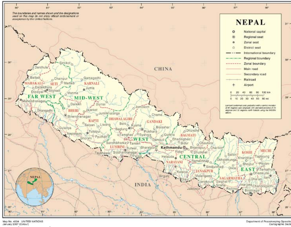
नेपालको नक्सा