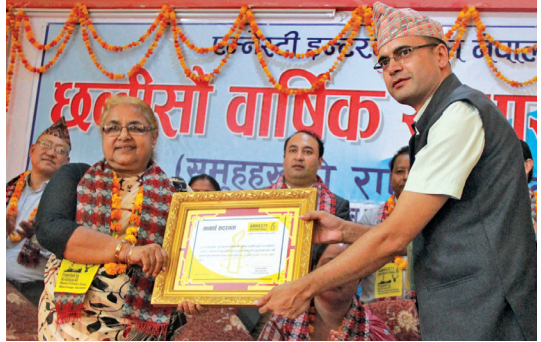
२७ असोज २०७४, पहिलक प्रधानन्यायाधिस श्री सुशिला कार्कीनह एम्नेस्टी नेपालके मानार्थ सदस्य देटी ।

नेपालम जोरजैना कौनो फे स्थानीय समूह या नेटवर्कहन् एम्नेस्टी इन्टरनेसनल नेपालमसे घरघरी अनुदान (फ्रॉन्सा) नै पाजाइए व एम्नेस्टी इन्टरनेसनल वसिक सड्ड अनुदान डेना डोनर (सखुइया) एजेन्सी फे नै हो । उहओसे स्थानीय नेटवर्क या समूह चलाइक लाग आवश्यक पर्ना आर्थिक स्रोत जुटाए रूप्या ख्यारक लाग कार्यक्रम कर्ना एम्नेस्टी इन्टरनेसनल समूह व युथ नेटवर्कके डोसूर महत्वपूर्ण काम हो ।