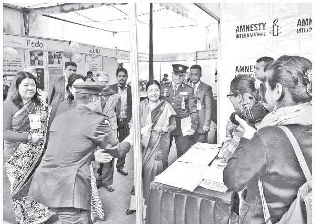
२३ मङ्सिर २०७४, ६९औं अन्तरराष्ट्रिय मानवअधिकार दिवसके सन्दर्भम एम्नेस्टी इन्टरनेसनल नेपाल चलैलक् मानवअधिकार सुचना ओ एक्सन डेस्कके राष्ट्रपति बिद्यादेवी भण्डारीसे अबलोकन कर्ती ।

एम्नेस्टी इन्टरनेसनल नेपाल इब्यालक अवस्था सम आचुकल म धेरठरिक ३८ जिल्लाम याकर ७८ से धेर स्थानिय समुह ओ ५४ युथ नेटवर्क र हल बाट् । यी संस्थाम हाल (डिसेम्बर २०१९ म) ड्यास् भर करीब ८००० सदस्यनहुक्र रहल बाट । उ सदस्य ओ यी संस्थाम आबद्ध स्थानिय समुह ओ नेटवर्कहुक्र एम्नेस्टी इन्टरनेसनल नेपालके प्राथमिकताम पर्लक अभियानहन स्थानियकरण (Localization) कर्ती मेरमेरके कचहेरी कर्ती आईल बाट ।