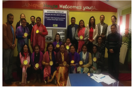
नारी दिवसम मानवअधिकार क्षेत्रम अगवा जन्नि मानवअधिकार अखोरेन सम्मान ।