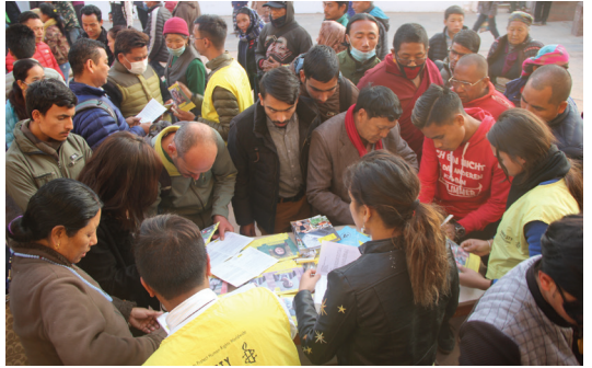
राइट फर राइट्स अभियान २०१८ म मानवअधिकार दिवस (डिसेम्बर १०) के दिन युवा सदस्यहुँक जनमानसहुँकहिन मानवअधिकार अभियानम संलग्न करैटि ।