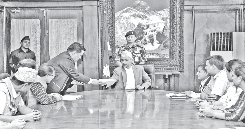
मन्त्रीपरिषदके उहब्यालक् अध्यक्ष खिलराज रेग्मीसे भ्याट्घाट कर्टी एम्नेस्टी इन्टरनेसनल नेपालके प्रतिनिधिहुक् । २०७० बैशाख (मे २०१३)

अधिकारीहन् चिठी लिख्ना, प्रदर्शन कर्ना, भेटघाट कर्नालगायतके विधिमेसे अभियान कर्त । असिक कर्लक अभियानके कारण गम्भीर मानवअधिकार