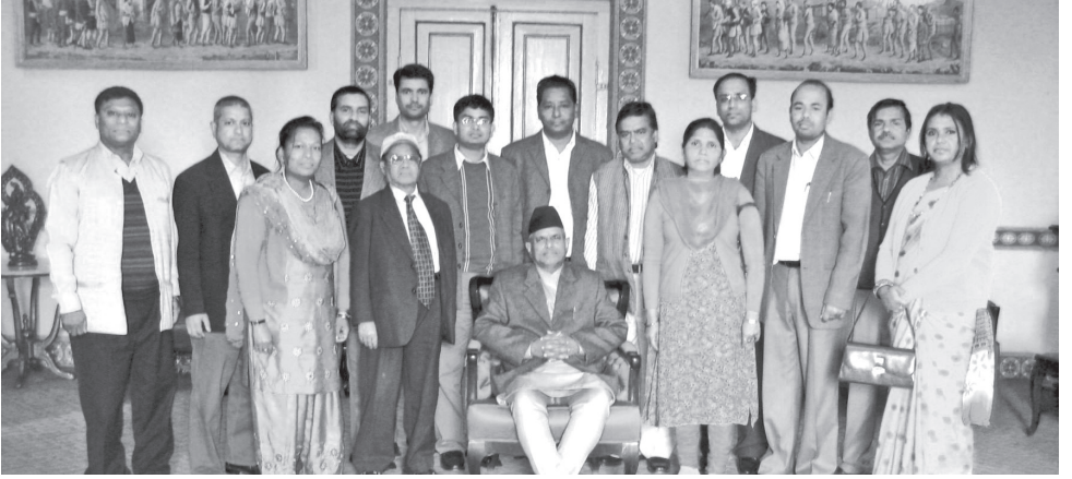
राष्ट्रपति डा. रामवरण यादवसँगे भेटघाट करैत एम्नेस्टी नेपालके प्रतिनिधिमण्डल । २०६५ फागुन (मार्च २००९)

नामक अभियानक शुरुआत कएल जएबाक उद्घोष कएने रहथि । ओ अभियान जखन विश्वव्यापी रूपमे ख्याति कमबऽ लागल तँ पीटर बेनेन्सन आ हुनक सहयोगीसभ अभियानकेँ संस्थागत रूपमें आगाँ बढएबाक लेल सन् १९६२ मे एम्नेस्टी इन्टरनेसनलक स्थापना होएबाक घोषणा कएलनि । बेनेन्सनक लिखल उएह लेख आ "अपील फार एम्नेस्टी १९६१" अभियान एम्नेस्टी इन्टरनेसनलक स्थापनाक कारक बनि गेल । ताहीसँ ओ लेख प्रकाशित भेल आ अभियान शुरु भेल दिन अर्थात् २८ मइ १९६१ केँ एम्नेस्टी इन्टरनेसनलक स्थापना दिवस मानल जाइत अछि । तहिना अभियानक शुरुआत कएनिहार पीटर बेनेन्सन एहि संस्थाक संस्थापक छथि ।