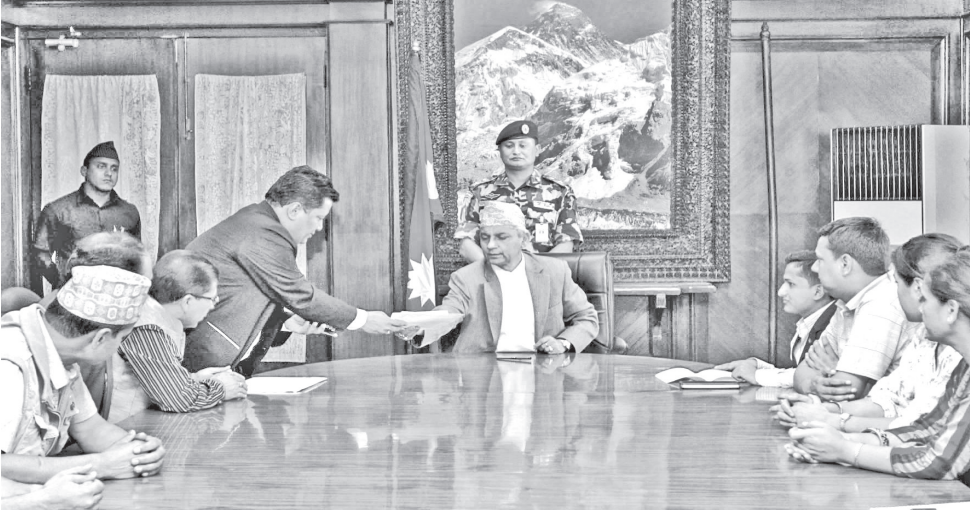
मन्त्रीपरिषद्के तत्कालीन अध्यक्ष खिलराज रेग्मीसँगे भेटघाट करैत एम्नेस्टी इन्टरनेसनल नेपालके प्रतिनिधिसभ । २०७० बैशाख (मे २०१३)

सम्बन्धित अधिकारीकेँ पत्र लिखबाक, प्रदर्शनसभ करबाक, भेटघाट करबाक आदि विधिसँ अभियान सञ्चालन करैत अछि । एहि तरहँ कएल गेल