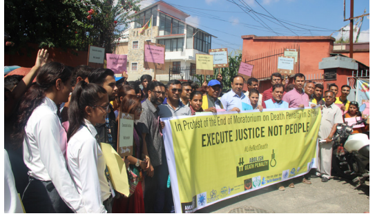
श्रीलङ्काको सरकारले मृत्युदण्ड ब्युताउन लागेको विरोधमा एम्नेस्टी नेपालका सदस्यहरूद्वारा प्रदर्शन