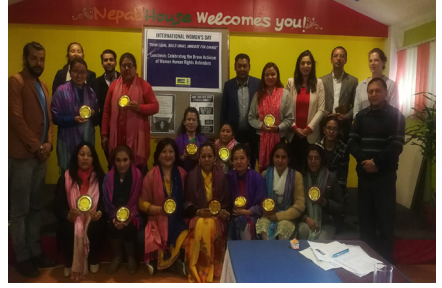
नारी दिवसमा मानवअधिकार क्षेत्रमा क्रियाशील महिला मा नवअधिकार रक्षकहरूलाई सम्मान

शाखा" (Nepal Section) को मान्यता प्रदान गर्‍यो । एम्नेस्टी इन्टरनेसनल नेपाललाई नेपालमा कार्यरत संस्थाहरूमध्ये एक अग्रणी मानवअधिकार संस्थाका रूपमा चिन्ने गरिन्छ ।