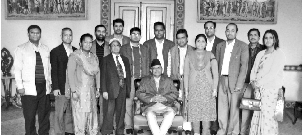
राष्ट्रपति डा. रामवरण यादवसँग भेटघाट गर्दै एम्नेस्टी नेपालको प्रतिनिधिमण्डल । २०६५ फागुन (मार्च २००९)

1961) नामक अभियानको थालनी गरिएको उद्घोष गर्नुभएको थियो । उक्त अभियानले विश्वव्यापी रूपमा ख्याति प्राप्त गरेपश्चात् पीटर बेनेन्सन र वहाँका सहयोगीहरूले सो अभियानलाई संस्थागत रूपमा अघि बढाउन सन् १९६२ मा एम्नेस्टी इन्टरनेसनलको स्थापना भएको घोषणा गर्नुभयो । बेनेन्सनले लेख्नुभएको सोही लेख र "अपिल फर एम्नेस्टी १९६१" अभियान नै एम्नेस्टी इन्टरनेसनलको स्थापनाको कारक बन्न पुगेको हुँदा लेख प्रकाशित भएको र अभियान थालनी भएको दिन अर्थात् २८ मे १९६१ लाई नै एम्नेस्टी इन्टरनेसनलको स्थापना दिवस मानिन्छ । त्यस्तै अभियानको थालनी गर्नुहुने पीटर बेनेन्सन यस संस्थाका संस्थापक हुनुहुन्छ ।