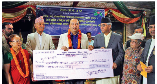
१८ बैशाख २०७३, एम्नेस्टी इन्टरनेसनल नेपाल रु. एक लाखको तेज-तीर्थ राष्ट्रिय लोकतन्त्र-शान्ति पुरस्कार २०७३ द्वारा सम्मानित ।

अर्थसङ्कलन अभियान सञ्चालनको अभिन्न पाटो भएकाले एम्नेस्टी इन्टरनेसनलमा