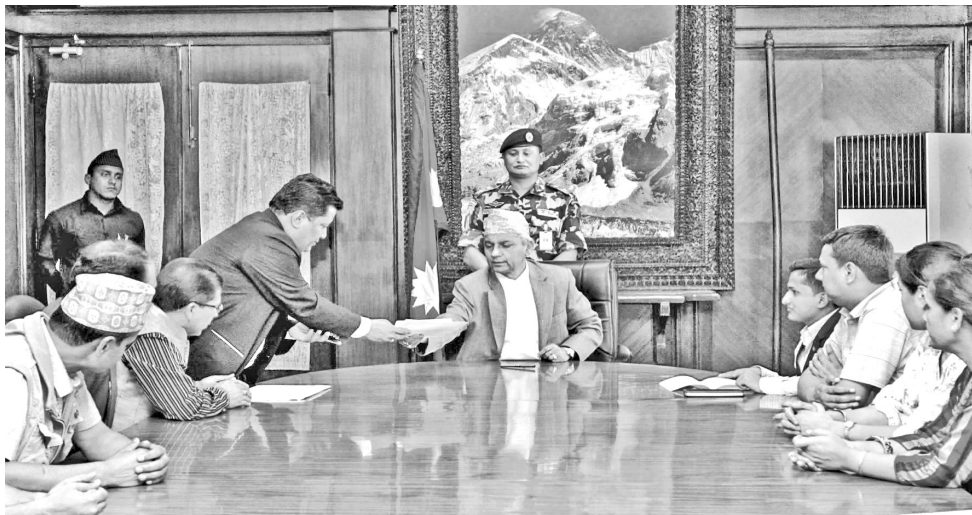
मन्त्रीपरिषद्का तत्कालीन अध्यक्ष खिलराज रेग्मीसँग भेटघाट गर्दै एम्नेस्टी इन्टरनेसनल नेपालका प्रतिनिधिहरू । २०७० बैशाख (मे २०१३)

र समर्थकहरूले सम्बन्धित अधिकारीलाई पत्र लेख्ने, प्रदर्शनहरू गर्ने, भेटघाट गर्ने लगायतको विधिबाट अभियान गर्दछन् । यसरी गरिएको