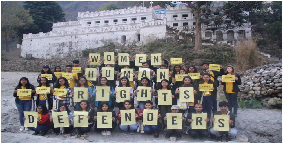
महिला मानवअधिकार रक्षकहरूको समर्थनमा पाल्पामा आयोजित १३औं युथ मेलाको दौरानमा 'फोटो स्टन्ट'