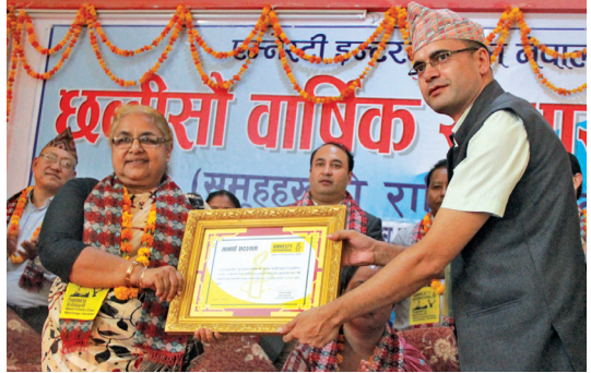
२७ असोज २०७४, पूर्व प्रधानन्यायाधीश श्री सुशीला कार्कीलाई एम्नेस्टी इन्टरनेसनल नेपालको मानार्थ सदस्यता प्रदान गरिँदै ।

आबद्ध स्थानीय नेटवर्क वा समूहको अर्को महत्त्वपूर्ण काम अर्थसङ्कलन हो । एम्नेस्टी इन्टरनेसनल नेपालमा आबद्ध हुने कुनै पनि स्थानीय समूह वा नेटवर्कलाई एम्नेस्टी इन्टरनेसनल नेपालबाट नियमित अनुदान प्राप्त हुँदैन र एम्नेस्टी इन्टरनेसनल त्यसरी नियमित अनुदान दिने खोनर एजेन्सी पनि होइन । तसर्थ स्थानीय नेटवर्क वा समूह सञ्चालनका लागि आवश्यक पर्ने आर्थिक स्रोत जुटाउन अर्थसङ्कलनका कार्यक्रमहरू गर्नु एम्नेस्टी इन्टरनेसनल समूह र युथ नेटवर्कको अर्को महत्त्वपूर्ण काम हो ।