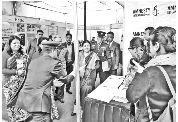
२३ मङ्सिर २०७४, ६९औँ अन्तर्राष्ट्रिय मानवअधिकार दिवसको सन्दर्भमा एम्नेस्टी इन्टरनेसनल नेपालले सञ्चालन गरेको मानवअधिकार सूचना तथा एक्सन डेस्कको राष्ट्रपति विद्यादेवी भण्डारीद्वारा अवलोकन गरिँदै ।

एम्नेस्टी इन्टरनेसनल नेपाल वर्तमान अवस्थासम्म आइपुग्दा विभिन्न ३८ जिल्लामा यसका ७८ भन्दा बढी स्थानीय समूह र ५४ युथ नेटवर्कहरू रहेका छन् । यस संस्थामा हाल (डिसेम्बर २०१९ मा) देशभर करीब ८,००० सदस्यहरू रहेका छन् । ती सदस्य र यस संस्थामा आबद्ध स्थानीय समूह र नेटवर्कहरूले एम्नेस्टी इन्टरनेसनल नेपालको प्राथमिकतामा परेका अभियानहरूलाई स्थानीयकरण (Localization) गर्दै विभिन्न कार्यक्रमहरू गरिरहेका छन् ।